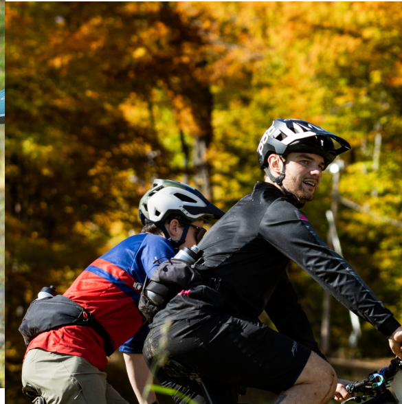
Relevez un défi